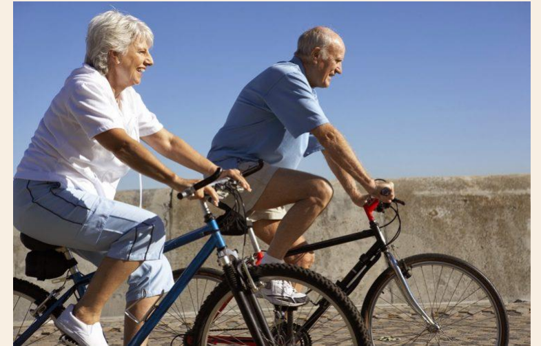
SAÚDE E LAZER