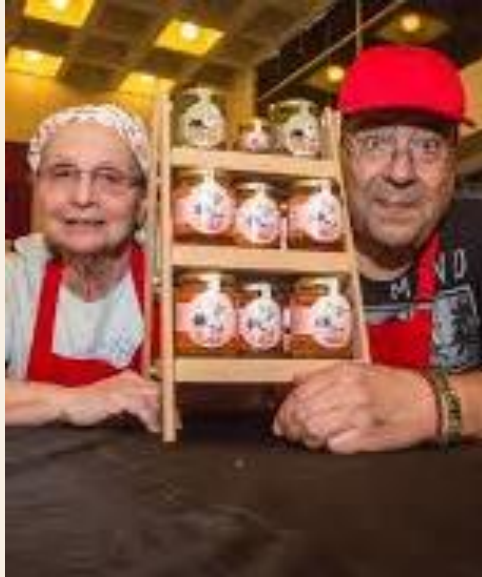
EDUCAÇÃO E EMPREENDEDORISMO