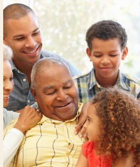
INTEGRAÇÃO SOCIAL E FAMILIAR